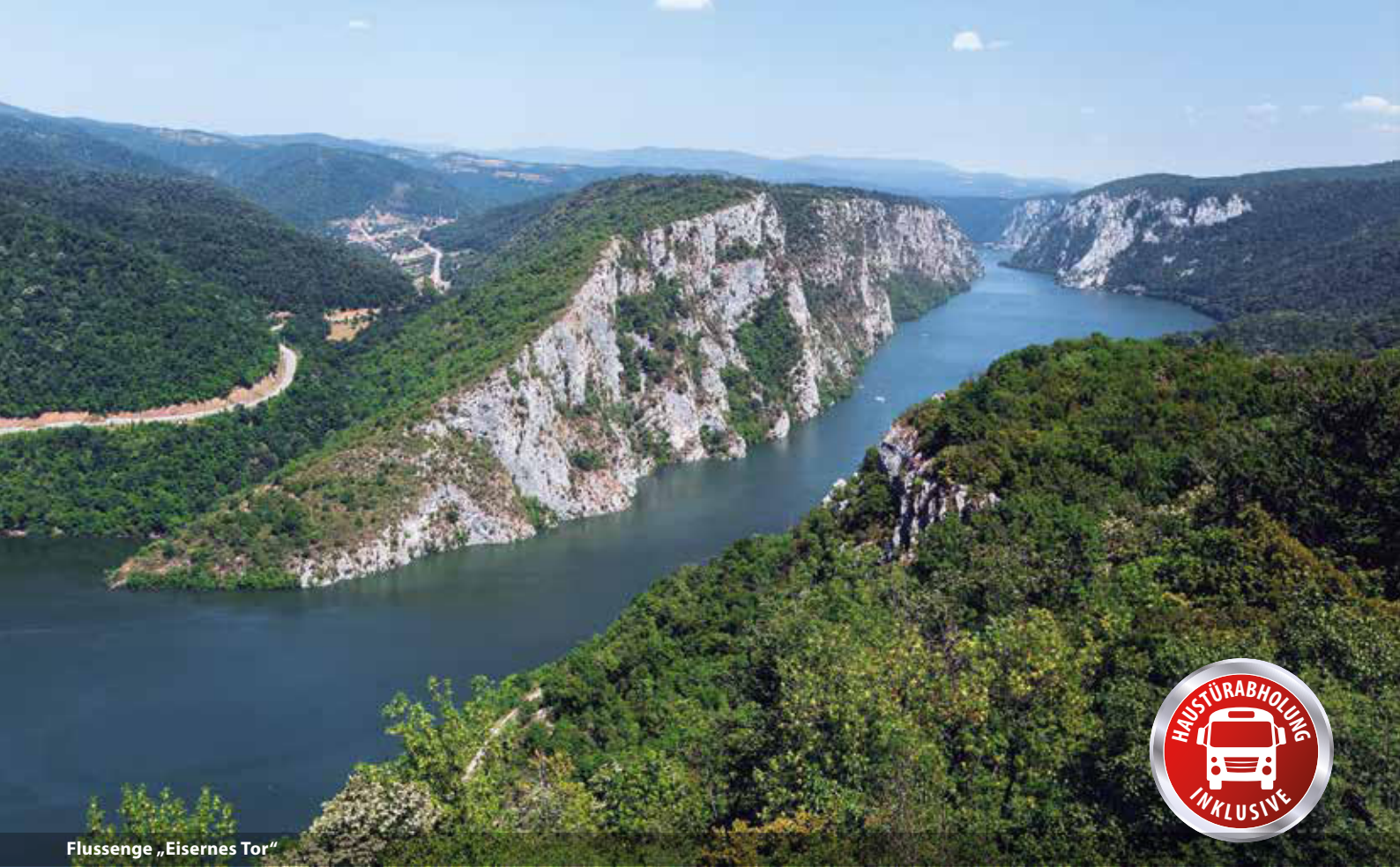
Flussenge „Eisernes Tor“