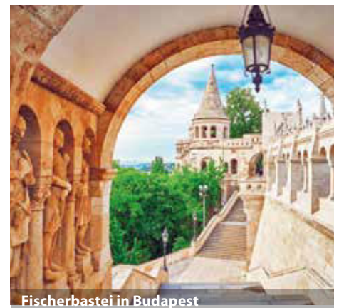
Fischerbastei in Budapest

Für diese Reise ist ein gültiger Personalausweis oder Reisepass erforderlich.