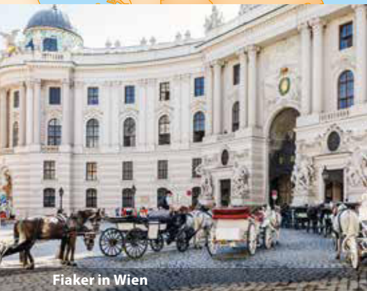
Fiaker in Wien

In Passau werden wir auf dem Deluxe-Schiff MS VistaStar herzlich begrüßt und beziehen unsere komfortable Kabine, unser Zuhause für die nächsten zwei Wochen. Nachdem wir die Schiffscrew beim Begrüßungscocktail kennen gelernt haben, kreuzen wir bereits über die Grenze nach Österreich.