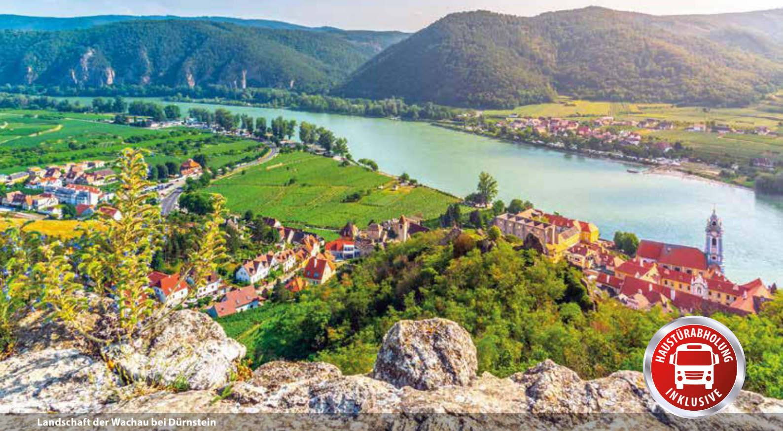
Landschaft der Wachau bei Dürnstein