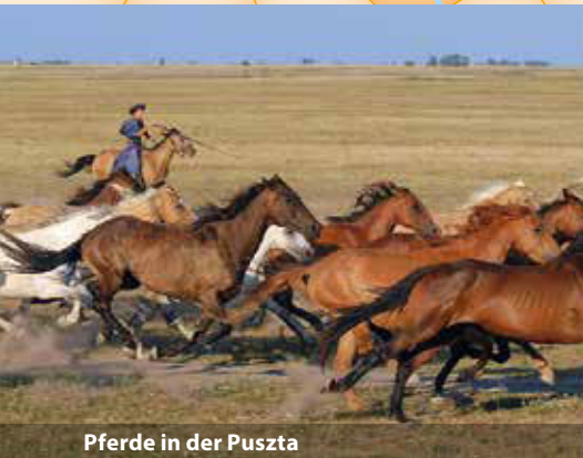
Pferde in der Puszta

In der Drei-Flüsse-Stadt Passau erwartet uns das Wohlfühlschiff MS VistaStar mit seiner freundlichen Schiffscrew. Abends legen wir bereits ab und kreuzen flussabwärts über die Donau. Nach der ersten Nacht in unseren großzügigen Kabinen wartet auf uns ein herrliches Frühstück mit Ausblick auf die zauberhafte Flusslandschaft. Gestärkt für den Tag machen wir am Vormittag einen Rundgang durch das niederösterreichische Spitz. Wir fahren durch die wunderschöne Wachau und legen am Abend in Wien an. In der Walzermetropole haben wir Zeit, die glanzvolle Stadt bei einer Besichtigung zu erleben und das schöne Schloss Schönbrunn mit seinen Barockanlagen zu besichtigen. Am nächsten Abend legen wir wieder ab und fahren durch die Nacht in Richtung Budapest.