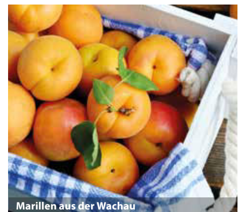
Marillen aus der Wachau

Haustürabholung: Von Beginn an soll ein Höchstmaß an Service, Entspannung und Erholung die Inhalte Ihrer Leserreise prägen. Sie werden ohne Aufpreis von einem Taxi oder Shuttle an der Haustür abgeholt und zum Zustieg des Transferbusses gefahren (analog bei Rückreise). Sie erhalten Ihre Reiseunterlagen spätestens 8-10 Tage vor Reiseantritt.