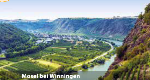
Mosel bei Winningen

In Köln erwartet uns bereits unser komfortables Zuhause der nächsten Tage. Beim Begrüßungscocktail an Bord von MS VistaSky lernen wir die zuvorkommende Schiffscrew kennen. Stromaufwärts geht es dann auch schon los Richtung Bonn und Siebengebirge.