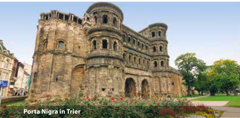
Porta Nigra in Trier