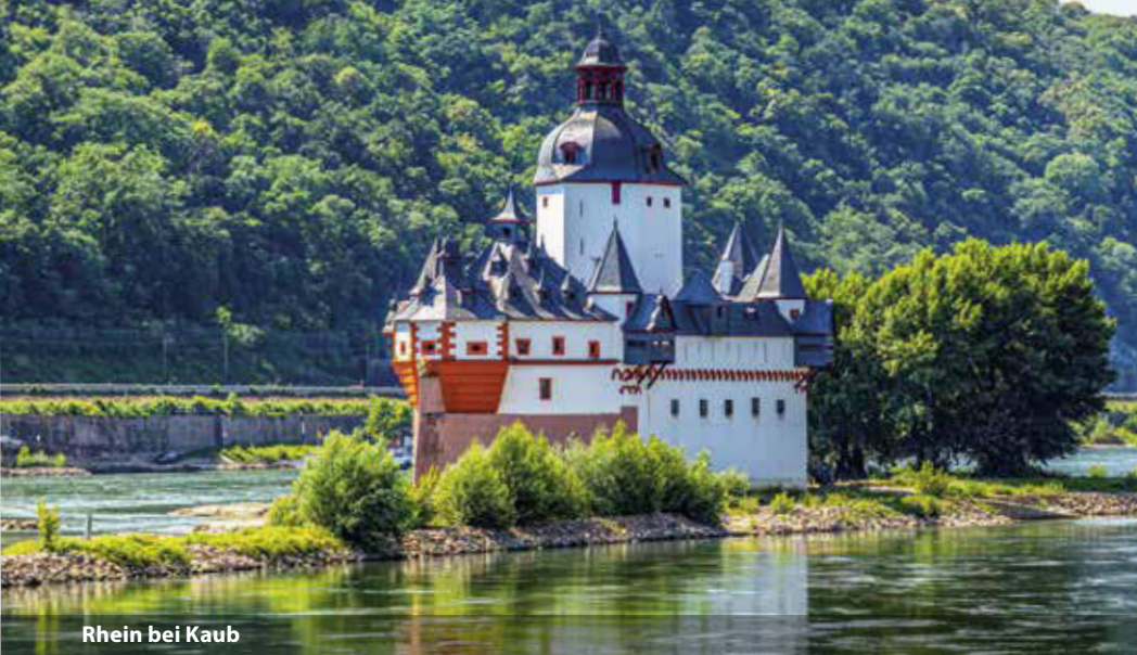
Rhein bei Kaub